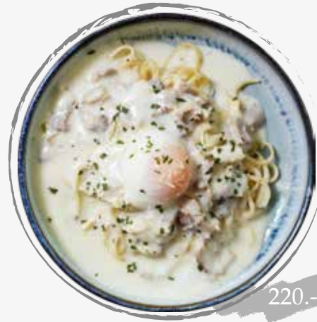
11. Linguine carbonara with onsen egg ลิงกวินีครีมซอสเบคอน ไข่ออนเซ็น