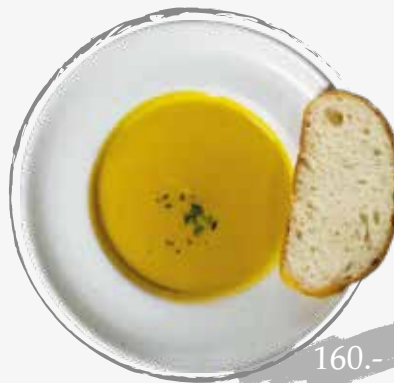
13. Pumpkin soup ซูปฟักทอง