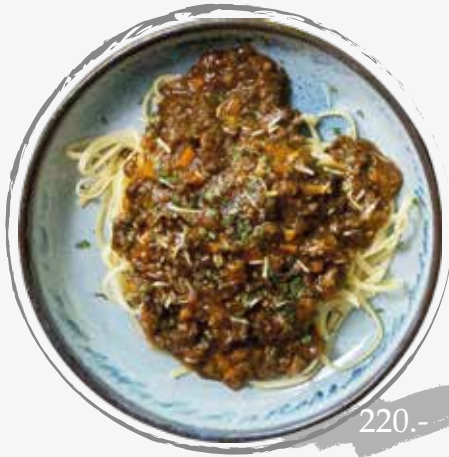
10. Linguine Bolonese ลิงกวินีซอสเนื้อ