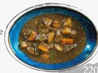
8. Japanese style beef curry with jasmine rice แกงกะหรี่เนื้อสไตล์ญี่ปุ่น เสิร์ฟพร้อมข้าวหอมมะลิ